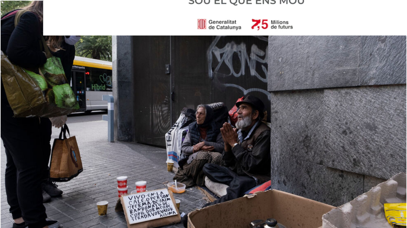
Dos voluntaris d'Arrels atenent a una parella que viu al carrer en ple confinament